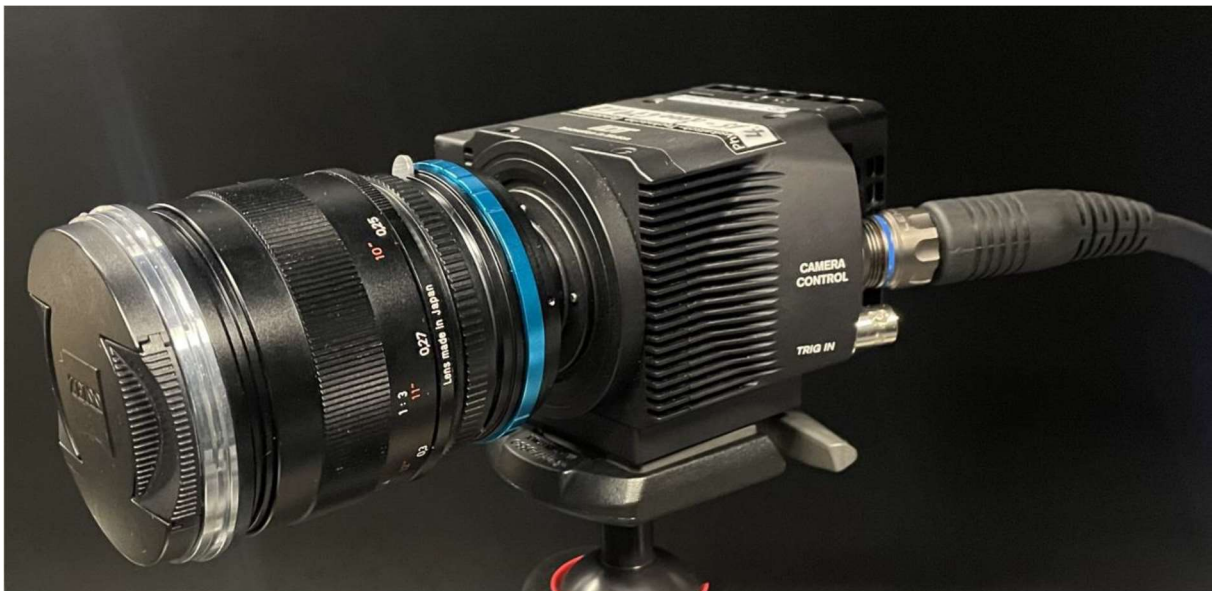
Abbildung 1: Foto der Hochgeschwindigkeitskamera IDT OS 7 – S3 von Imaging Solutions mit ZF.2 Makro-Planar 2/50 Objektiv des Herstellers Carl Zeiss.

Für die Aufnahmen wird eine Hochgeschwindigkeitskamera IDT OS 7 – S3 vom Hersteller Imaging Solutions verwendet (siehe Abbildung 1). Diese ist mit einem CMOS-Sensor mit einer Farbtiefe von 12/36-Bit und einem 32 GB DDR Ringspeicher ausgestattet. Der Sensor verwendet einen Global Shutter. Laut Spezifikation weist dieser eine minimale Integrationszeit von 1 Mikrosekunde auf. Bei einer Auflösung in HD (1920 x 1280 Pixel) können Bildsequenzen mit einer Rate von bis zu 4200 fps und bei Verringerung der Auflösung von bis zu 130000 fps aufgenommen werden. Außerdem besitzt die Kamera einen als Bayer-Matrix RGB-Farbfilter. [13]