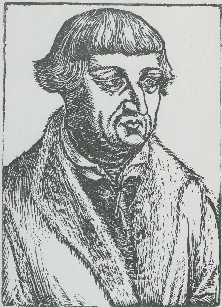
Johann Bugenhagen nach altem Original in Holz geschnitten von Felix Tornier