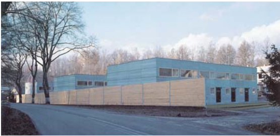
4 | ARCHTEAM, Reihenhäuser in Rudník/Nordböhmen

Auch das zweite Gebäude, das ich vorstellen möchte, die Bibliothek der Philosophischen Fakultät in Brunn der Architekten Kuba und Pilař 4 (Abb. 6, 7), hat unbestreitbar seine Qualitäten. Als Ganzes schätze ich es hoch, vor allem wegen der Gestaltung und Geschlossenheit des Hofraumes und auch wegen der einfühlsamen Artikulation der