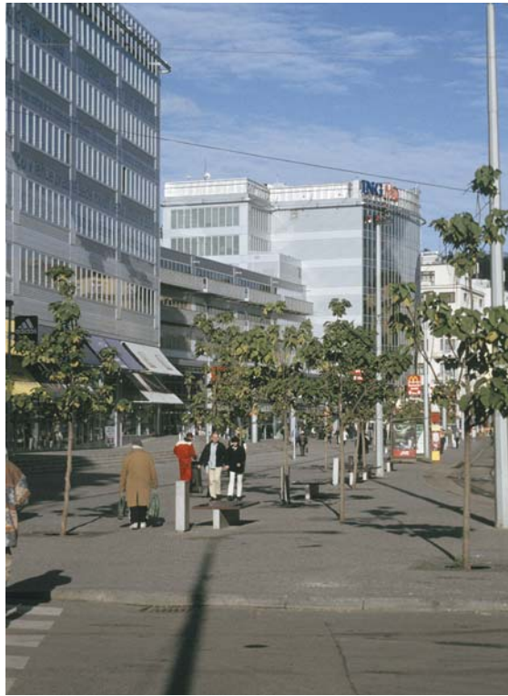
10 | „Anděl“ – ein neuer öffentlicher Raum

schaft“ doch trotz allem das Wesentliche ist. Also dass in der Architektur, in der heute so besessen mit unterschiedlichen Ausdrucksmitteln experimentiert wird, d. h. mit dem „wie“, die wesentliche Frage das „was“ bleibt, also was kann und soll durch die Architektur über die Welt des Menschen ausgesagt werden.