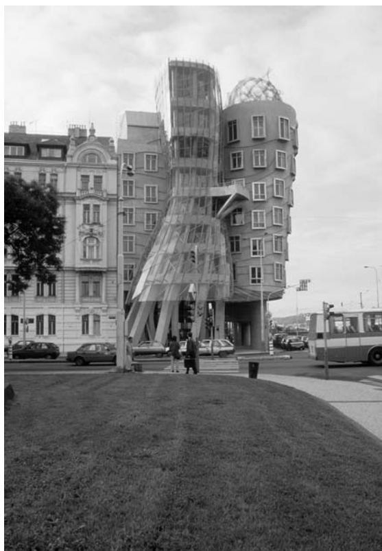
8 | Frank O. Gehry, Vlado Milunič, „Tanzendes Haus“, Prag