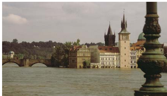
3 | Moldau-Hochwasser in Prag

Ich erwähne diese zwei Ereignisse zu Beginn meines Beitrags keineswegs, weil ich durch spektakuläre Kontraste schockieren möchte. Diese beiden Beispiele repräsentieren lediglich zwei entgegengesetzte Pole, zwischen denen sich die Architektur immer bewegt: von den unmittelbaren Hinweisen, die sich aus dem physischen Charakter der Bauten und ihrer praktischen Funktion ergeben, über die gesellschaftliche Relevanz bis hin zu kompliziert vermittelten kulturellen Inhalten, die auf der geistigen Aneignung der Welt beruhen; von konventionellen, erlebten Zeichen bis zu erfinderischen Idiosynkrasien. Auf der theoretischen Ebene meines Vortrags werde ich mich der Frage widmen, wie sich diese unterschiedlichen Bedeutungsschichten in der Sprache der Architektur durchdringen. Vor allem stelle ich jedoch die Frage, ob es in der gegenwärtigen Architektur nicht zu einer Trennung dieser Bedeutungsschichten kommt, die sich dann als quasi-selbständige Sprachen entwickeln und schwer eine Beziehung zur