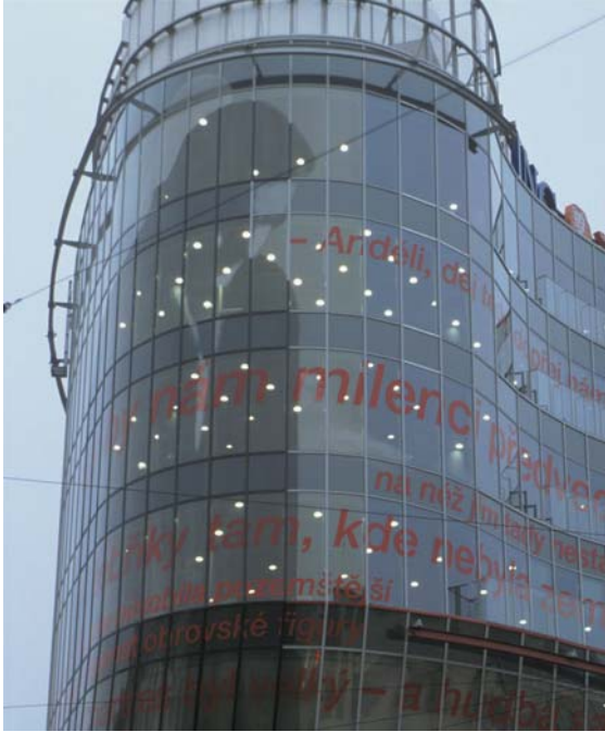
1 | Jean Nouvel, „Anděl“ – Detail der Ecke

Zwei Ereignisse traten in der jüngsten Vergangenheit in das Stadtbild Prags: Jean Nouvel errichtete im Jahr 2000 ein neues Gebäude an einer Stelle, die traditionell „U anděla“ – „Zum Engel“ genannt wird (Abb. 1, 2). An diese Tradition erinnert an der Fassade des Nouvelschen Baus ein Bild eines Engels, der allerdings aussieht wie ein Engel aus Wim Wenders Film Himmel über Berlin . 1 Dieser fremde (Berliner) Engel ist von Gedichtauszügen umgeben, die – aus ihrem Kontext gerissen – wie ein zufälliges Zusammentreffen poetischer Vorstel-