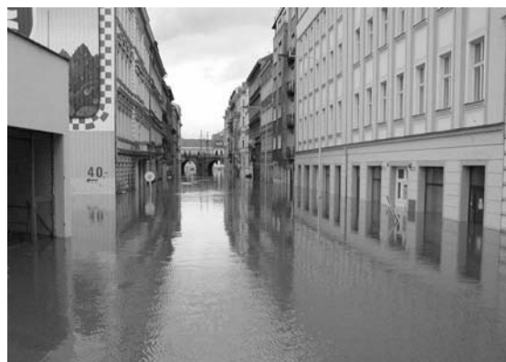
9 | Überschwemmte Straße im Prager Stadtteil Karlín