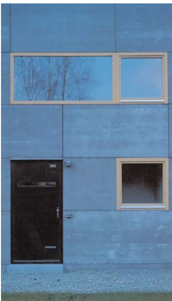
5 | ARCHTEAM, Reihenhäuser in Rudník – Detail des Eingangs