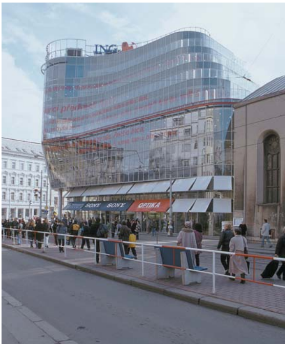
2 | Jean Nouvel, „Anděl“ – Nordflügel

lungen wirken. Dieses und viele weitere Beispiele können Ausgangspunkt für Überlegungen nicht nur zur wechselseitigen Beeinflussung und Durchdringung der Sprachen verschiedener Medien sein; sie sind vor allem Anregung zum Nachdenken über die Sprache der Architektur, die sich im immanenten Kreis rein kultureller Bedeutungen bewegt, deren spürbare Beziehung zur Wirklichkeit oftmals in der Kette der Hinweise und Interpretationen verloren geht und sich schwer durch eine weitere, diesmal theoretische Interpretation dechiffrieren lässt.