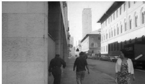
1-10 | (v. o. n. u., v. l. n. r) Stills aus Antonionis „La Notte“, 1960