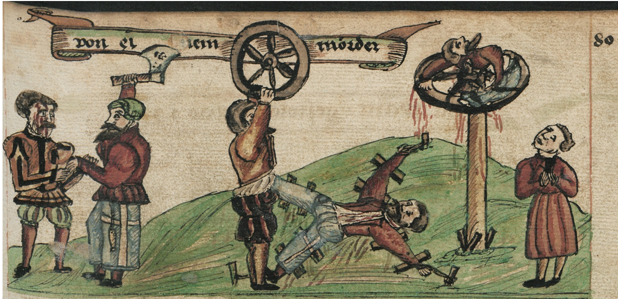
Bestrafung eines Mörders. Berlin, Staatsbibliothek, Ms.boruss. fol.176, fol. 80r (Ausschnitt).

buchgeschichtlicher Weg eingeschlagen, wobei jeder einzelne Kodex erlaubt, Rückschlüsse auf das intellektuelle Umfeld zu einem bestimmten Zeitpunkt zu ziehen.