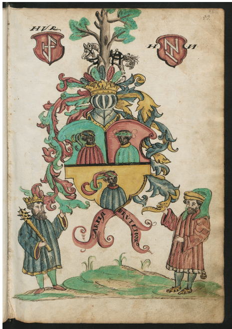
Arma Brutenorum. Berlin, Staatsbibliothek, Ms.boruss. fol.176, fol. XXIIIr.

Weiterhin wird ein Schwerpunkt auf den Entstehungsort der Kodizes gelegt und Danzig als literarischer Raum behandelt, um die Besonderheiten der handschriftlichen Überlieferung der Danziger Historiographie sichtbar zu machen. Damit wird eine Grundlage für die Analyse des erweiterten Rezeptionsverhaltens und der Rezipientenorientierung geschaffen, die in den weiteren Teilschritten des Dissertationsprojekts aufgegriffen wird.