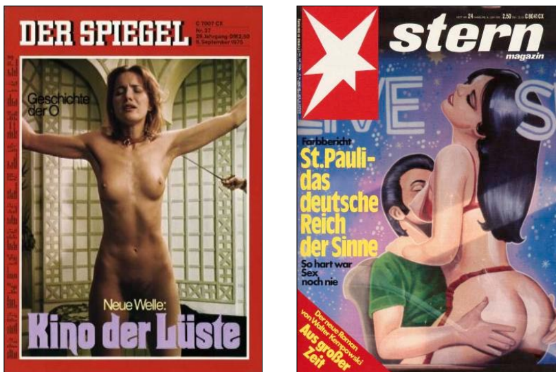
Abb. 4: „So hart war Sex noch nie“ – das Sexualitätsdispositiv um und nach 1968 (Links: Titelblatt des Spiegel 37/1975. Rechts: Titelblatt des Stern 24/1978).

Ihre – historisch rekonstruierbare – Bedeutung gewann die Darstellung sexualisierter Gewalt noch stets innerhalb einer öffentlichen Auseinandersetzung (Abb. 4). Sie erhielt diese nicht von diesem oder jenem – philosophisch reflektierbaren – „Kunstwerk“ an und für sich, sondern erlangte diese immer wieder neu innerhalb eines jeweils ganz bestimmten Sexualitätsdispositivs in einem sehr viel umfassenderen Sinne, in Wechselwirkung mit zahlreichen anderen pornographischen Texten und Bildern, Publikationen und Filmen und deren jeweiliger Rezeption.