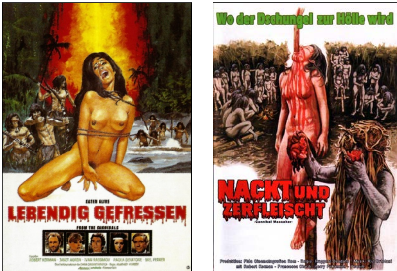
Abb. 10: „Lebendig gefressen“ – „Ekstase“ und „Exotik“ (Links: Filmplakat zu Lebendig gefressen von 1980. Rechts: Filmplakat zu Nackt und zerfleischt von 1980).

„stellten Sexualität als ein Problem dar, dessen Lösung eine bessere oder andere Sexualität“ war – eine als exotisch mystifizierte ars erotica . 86 Zum anderen ging diese Exotisierung sexualisierter Gewalt mit der wachsenden Popularität von als „asiatisch“ beworbenen „Kampfkünsten“ einher, nicht allein, aber auch in der Bundesrepublik Deutschland. 87 Sowohl im Rahmen der ars erotica als auch im Rahmen der sogenannten martial arts wurden Gewaltpraktiken und Selbsttechniken gezielt ineinander überführt – als Ausdruck einer Sinnsuche.