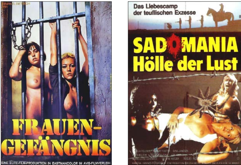
Abb. 5: Frauen im Widerstand? (Links: Filmplakat zu Frauengefängnis von 1975. Rechts: Filmplakat zu Sadomania – Hölle der Lust von 1980).

Doch während ein „Skandalfilm“ wie Die 120 Tage von Sodom auch heutzutage noch kontrovers diskutiert wird, sind zahlreiche „Trashfilme“, die kaum weniger in die um und nach 1968 quasi omnipräsente Politisierung der Sexualität verwickelt waren, inzwischen weitgehend in Vergessenheit geraten – insbesondere die sogenannten „Frauengefängnisfilme“ (Abb. 5). 63