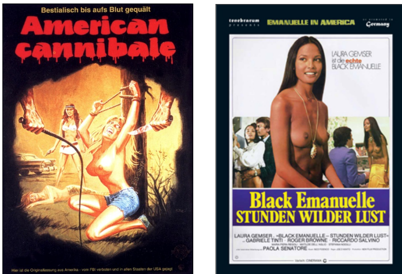
Abb. 11: Der „Snuff-Film“ und die „Eskalation des Sadismus“ (Links: Filmplakat zu American cannibale – Snuff von 1976. Rechts: Filmplakat zu Black Emanuelle – Stunden wilder Lust von 1977).

Der dieses Subgenre anfangs prägende Softcore-Pornofilm American cannibale – Snuff von 1976 vermochte die Gewalt gegenüber Frauen teilweise bemerkenswert realistisch in Szene zu setzen. Am Ende des Films, scheinbar bereits nach dem eigentlichen Drehschluss, hält eine Freihandaufnahme angeblich die tatsächliche Ermordung – die Verstümmelung und Zerstückelung – einer Frau fest. 94 Der vielleicht bekannteste „Snuff-Film“ stammt jedoch wiederum aus der international erfolgreich vertriebenen Black-Emanuelle-Reihe – der Softcore-Pornofilm Black Emanuelle – Stunden wilder Lust von 1977. Auch in diesem Film hält eine Freihandaufnahme – als Film im Film – vermeintlich die tatsächliche Ermordung mehrerer Frauen fest, in Schwarzweiß, ohne Ton und geradezu erschreckend realistisch in Szene gesetzt (Abb. 11). 95