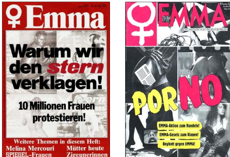
Abb. 12: „PorNo“ – die Anti-Pornographie-Bewegung (Links: Titelblatt der Emma 8/1978. Rechts: Titelblatt der Emma 12/1987).

Emma an dieser Stelle von einem lediglich „kleinen Schritt“ gesprochen. 109 Catharine MacKinnon bezeichnete die Pornographie zum Auftakt der „PorNo-Kampagne“ sogar als ein „Instrument des sexuellen Faschismus“ – es gehe der Anti-Pornographie-Bewegung streng genommen nicht um Texte oder Bilder, sondern um „Taten gegen Frauen“. 110