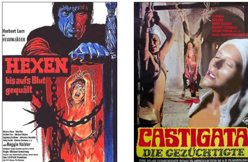
Abb. 8: Hexen und Nonnen – „gequält“ und „gezüchtigt“ (Links: Filmplakat zu Hexen bis aufs Blut gequält von 1969. Rechts: Filmplakat zu Castigata – die Gezüchtigte von 1974).

der sogenannte nunsplotation film . Innerhalb dieses Subgenres bediente sich die Brutalisierung der Sexualität weder des Narrativs einer Pathologisierung noch des Narrativs einer Dämonisierung, sondern in erster Linie eines Narrativs der Historisierung sexualisierter Gewalt: In zahlreichen pornographischen Texten und Bildern, Publikationen und Filmen wurde die Gewalt gegenüber Frauen in eine andere Epoche verlegt, in der Regel in das Mittelalter bzw. in die Frühneuzeit, mitunter aber auch in die Antike (Abb. 8). Ob am Beispiel von vermeintlichen Hexen oder widerständigen Nonnen, die Brutalisierung der Sexualität bediente sich innerhalb dieser – meist handelte es sich um – Softcore-Pornofilme eines zeitlichen Entrückens und neugierigen Bestaunens. 76 Auffallend häufig bewegte sich diese Historisierung sexualisierter Gewalt dabei vor einem mehr oder weniger religiösen Hintergrund und verband sich mit einer zeitgenössisch geradezu allgegenwärtigen Kritik gegenüber der Kirche und deren sogenannten „Sexualunterdrückung“. 77