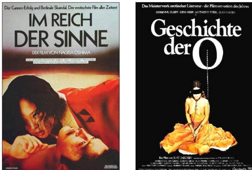
Abb. 3: Die „Verewigung der Ekstase“? Sadismus und Masochismus (Links: Filmplakat zu Im Reich der Sinne von 1976. Rechts: Filmplakat zu Geschichte der O von 1975).

Frauen wurden dieser Gewalt und ihren damit einhergehenden Gefühlen um und nach 1968 meist vollkommen unfreiwillig ausgesetzt – um sich mitunter allmählich, aber dann scheinbar freiwillig auch selbst der Gewalt und diesen Gefühlen zu unterwerfen. In nahezu allen der in diesem Kontext zur Diskussion stehenden pornographischen Texte und Bilder, Publikationen oder Filme geht es mithin, wie sich noch zeigen wird, um Sadismus und nicht um Masochismus bzw. Sadomasochismus im Sinne von vollkommen einvernehmlich eingegangenen Gewaltverhältnissen. Am Beginn der ausgiebig beschriebenen Gewaltverhältnisse stand fast immer eine Vergewaltigung – und keine Verzückung.