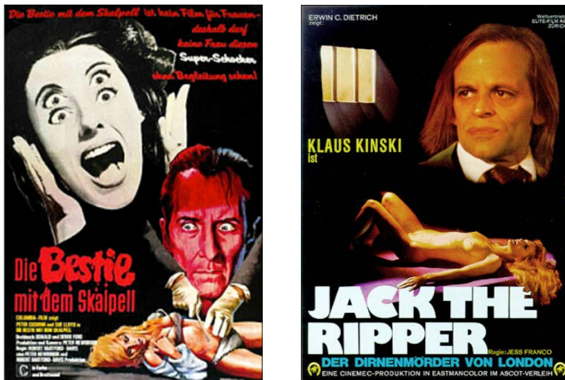
Abb. 7: „Triebtäter“ und „Serienmörder“ – „kein Film für Frauen“ (Links: Filmplakat zu Die Bestie mit dem Skalpell von 1968. Rechts: Filmplakat zu Jack the Ripper – der Dirnenmörder von London von 1976).

Das Ausmaß an Gewalt, das im Rahmen derartiger Genrevermischungen zwischen Porno und Horror aufseiten der Anti-Pornographie-Bewegung beobachtet wurde, war alles andere als „rein fiktiv“. 72 Es war schlichtweg beispiellos. Die Gewalt äußerte sich zudem nahezu ausschließlich gegenüber Frauen, bis hin zum – schonungslos vorgeführten – Herausschneiden der Gebärmutter und Abschneiden der Brüste. 73