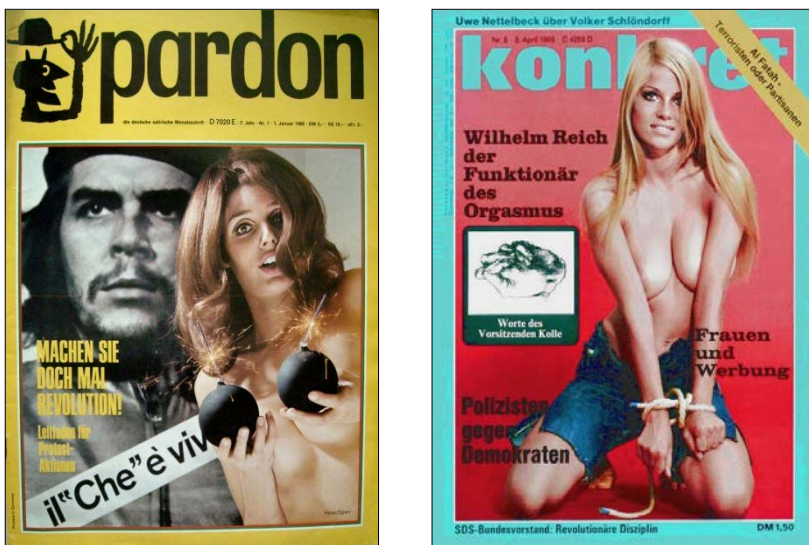
Abb. 1: Bomben und Fesseln – „freie Entfaltung“ in der „sexuellen Revolution“ (Links: Titelblatt der Pardon 1/1968. Rechts: Titelblatt der Konkret 8/1969).

ren zu müssen, dass es letztlich darauf ankomme, gegen die „Ursache“ der – seinem Eindruck nach lediglich teilweise zu beobachtenden – Amalgamisierung von Sexualität und Brutalität vorzugehen und er glaubte eben diese in der inhärenten, häufig aber eher indirekten „Brutalität dieser Gesellschaft“ ausfindig gemacht zu haben. 29 Die bis heute oftmals erhitzt geführte Debatte um die Darstellung sexualisierter Gewalt besaß diesbezüglich in den 1970er und 1980er Jahren zahlreiche Bezüge zur zeitgleich öffentlichkeitswirksam vorangetriebenen Diskussion um die Bedeutung der sogenannten „strukturellen“ Gewalt. 30