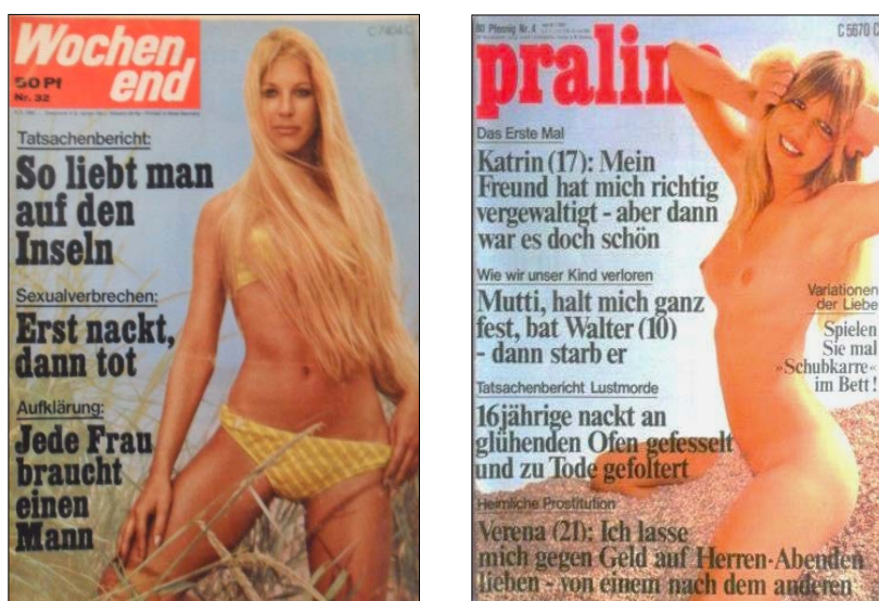
Abb. 6: „Erst nackt, dann tot“? Männliche „Täter“ und weibliche „Opfer“ (Links: Titelblatt der Wochenend 32/1969. Rechts: Titelblatt der Praline 4/1972).

Statt diese Form des sexploitation film als subversiv zu interpretieren, schlägt der vorliegende Beitrag vor, sie innerhalb des Sexualitätsdispositivs der 1970er und 1980er Jahre zu kontextualisieren. 65 Die Verknüpfung von visualisierter Lust und sexualisierter Gewalt ereignete sich nämlich keineswegs nur im Rahmen jener Politisierung der Sexualität. Männer als „Täter“ und Frauen als „Opfer“ dieser Brutalisierung der Sexualität erfuhren um und nach 1968 – zwar keine Omnipräsenz, aber doch – eine bemerkenswerte Dauerpräsenz in den Massenmedien.