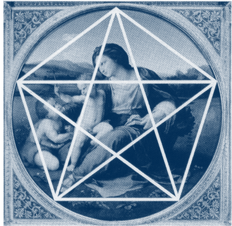
Raphael: Alba Madonna